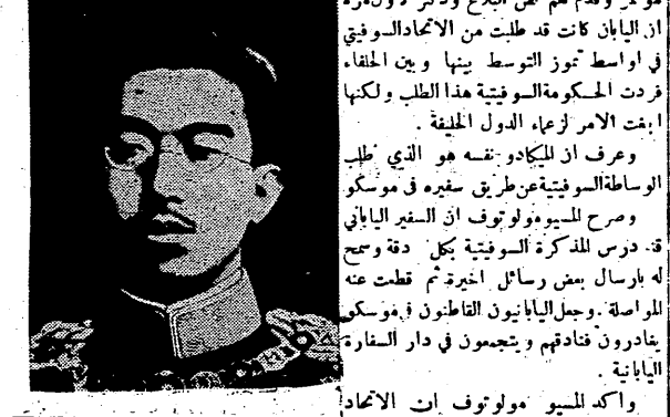
امبراطور اليابان واعدت محطات الاذاعة برنامجاً لاذاعة «النبا» حالا يريد وجاء من لندن ان التوتوف فيها هي الاخرى جد شديد و يتقدمون اذ اني جنوح من اليابان لاشتمال يجب ان يسبقه تبادل في الحكومة باستقالة الوزارة الحالية وقيام وزارة جديدة اعطاء اليابان فرصة اخرى. والسلطات الاميركية تنتظر النتيجة في اتجاه ما او آخر خلال ايام او ساعات. وقد وصل التوتوف في واشنطن ليلة امس الى مدى بعيد

وشنطن في ٩ - ٨ - ٤٥ - طلب الرئيس ترومان المستر ترومان، وزير الحرية الحضور الى البيت الابيض صباح اليوم، فالتى اجتمع الصحفي، واثار هذا الطلب الاقرب ان هناك تطورات مهمة جديدة. ودمي البيت الابيض ايضا المستر بوليتوس كروغ، رئيس مجلس الانتاج الحربي، والمسترون ستايدر، مدير التفتة الحربية والمسترون تشستر بوز، مدير الاسعار. وقد رفضوا جميعا التلحق ببيء على اجتماعهم بالريس. غير انه يلاحظ مع ذلك بانهم سيكوتون بكتبتهم ذوي شأن خطير في حالة انتهاء الحرب اليابانية فجأة!