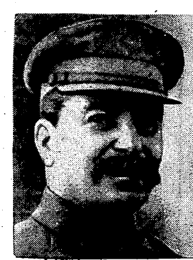
المرشال ستالين الحرب. وقد ذاعت اليابان اليوم «عينة» من الهجمات المتعددة الاضلاع التي كتبت عليها... وتنسيق

عبور حدود منشوريا طوكيو في ٩ - ٨ - ٤٥ - يقول بلاغ ياباني ان القتال يدور الآن بين الروس واليابانيين على الحدود الشرقية للبرية في منشوريا.