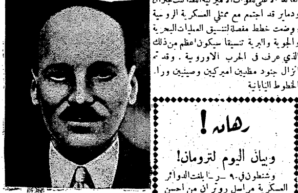
المستراتلي اليكادو نفسه موسكو في ٩ - ٨ - ٤٥ - ما مضت ساعات ونصف الساعة على ابلاغ اللسيو مولوتوف السفير الياباني اعلان الحرب حتى دعا الضغائن الى

شونكنغ في ٩ - ٨ - ٤٥ - اعلن هنا اليوم ان