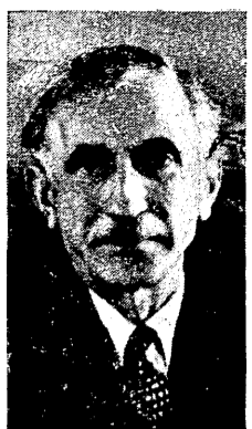
بيروت في ٢٨ - ١٠ - ٤٠ ع. التي دولة عبد الحميد كرامة رئيس الوزارة اللبنانية في مجلس النواب اللبناني...

فلسطين» في ١ آذار سنة ١٩٤٥ سيدى مدير جريدة فلسطين المحترم اطلت على مقالكم الواردة في العدد قبل الاخير بخصوص مطالب الامة الاسرائيلية...