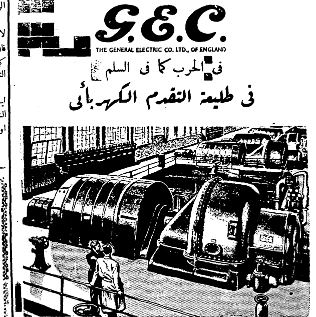
ان ما كانت توليد الكهرباء لشركة الجبال الكرك التي تصل الى ذروة ما يمكن استهلاكه من قوة كهربائية لمشاريع البلديات المصرية ، وللعمال الصناعية ، قد سبق تصنيفها من قبل مهندسين كهربائيين هنا وفيها وراء البحار

يدرس صندوق الامة وفروعه قضايا الاراضي المهددة بالبيع في كل مدينة وقريبة ثم يضع تقريراً عن الحالة . وبعدئذ تتألف وفود كثيرة من مختلف الجهات لزيارة تلك المناطق والتحدث مع اهله لاتعاقب بالاحتياط