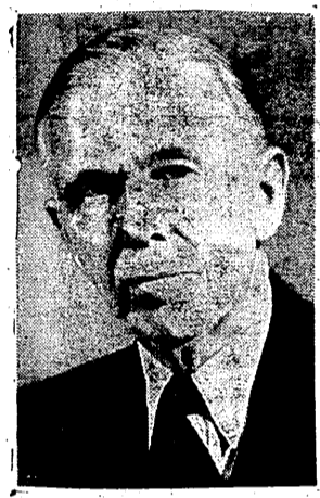
الرئيس الربيته بيغن، مع السيو بيغو

لندن - استقر رأي الوزارة البريطانية حول النقاط الرئيسية التي ستبنيها في سياستها تجاه (مشروع مارشال) واعطت المستر بيغن قبل سفره الى باريس تعليمات واضحة محدودة بهذا الشأن. والمسألة التي لا تزال تحتاج الى ايضاح هي ما اذا كان مشروع مارشال يشمل اقطار الشرق الاوسط ... ووجهة نظر بريطانيا في هذا هي انه يجب ادخال الشرق الاوسط بأكمله واعتباره جزءاً من مشروع التحسين الذي دعا اليه المستر مارشال وزير الخارجية الاميركية، على ان يكون لهذه الاقطار المكان الثاني بعد اقطار اوربوا التي هي في افس الحاجة الى التعديل لارشان ستاين هذا المني ان يكون الاتحاد السوفياتي احدي الدول الثلاث الداعية فيه من الدول اوربية لوضع بيان بالمساعد الطولية. على ان المذكور لم يفتح قد قدم المارشال ستاين الى باريس هذا الفرض بنفسه واعترضت تقدم السيو مولوتوف ويحق لروسيا ان تدخل في مشروع المستر مارشال لان المشروع يتناول «كل بل يقسم الى الغرب من اسيا» واجتمع في وزارة الخارجية البريطانية يومين ووزير خارجية بريطانيا السيرة بيغن ووزير خارجية فرنسا السيو بيغو من خبراء الطرفين وواصلت البحث في وسائل تحقيق مشروع المستر مارشال ويقال ان التفاهم تام بين الساسة البريطانيين والفرنسيين على النقاط الهامة في المشروع ووصفت المحادثات بأنها تدور في جو ودي ولا ينظر ان يعود المستر بيغن الى لندن قبل يوم غد هنا وقد ابرم مجلس الوزراء الفرنسي اليوم معاهدة الحلف البريطانية الفرنسية التي قدمتها في دنكرك السترين والسو بيغو ويوغوسلافيا في باريس قد اتفقت بالادوات