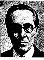
المستر نوبل بيكر

لندن في ١٢ - و - اجاب المستر نوبل بيكر وزير الدولة البريطاني على مناقشة قضية دارت في مجلس العموم الالية اللامضية بشأن اندونسيا فقال ان الهولنديين قاموا بالبادرة اولاً بحيث اصبح الواجب على الاندوفسيين ان يابلرو هذه البادرة بمقترحات مماثلة اذا رغبو في ذلك وقال انه يأمل ان يحول الحكومة الهولندية السوقان موك - وهو الان في طريقه الى هولندا - صلاحيات مفاوضة كي يبالغ الشكلة الاندونسية على اسس متينة موقفة وتحتمل تأمل ونطلب بان يجلس الهولنديون والاندونسيون مع بعضهم البعض ويصالحوا الاختلافات القائمة فيما بينهم على اسس مقترحات