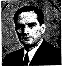
الاستاذ كميل شمعون

تم ان الحكومتين وما شديدا الرغبة في تمكين سوريا ولبنان من ممارسة الاستقلال الذي اعلنته فرنسا في سنة ١٩٤١ وتثبيت قبول الدولتين في صفوف الامم المتحدة في استرجاع النتائج الطبيعية للتأني عن انتهاء القتال واثار ذلك على ترتيب قوات الحلفاء في الشرق قد قررت ان تدرسها شروط اعادة ترتيب قواتها ترتيبا منظما وسحب كل قوة عسكرية من هذه المنطقة ولهذا الغرض فيجتم في بيروت يوم ٣١ كانون الاول سنة ١٩٤٥ الخبراء العسكريون البريطانيون والفرنسيون وسيكون من اهم اغراضهم تعديل موعد جلاء قريب لاول خطوات الانسحاب وقدمت المستر ايدنوزر الخارجية السابق للمستتر يفين والذين علموا منه «على هذه الخطوة المهمة في سبيل حل هذه المشكلة المزمنة» ورجا ان يرحب السوريون بالاتفاق