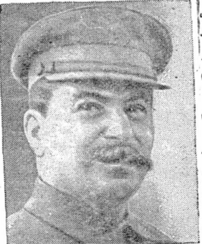
موسكو في ٩ - ر - جمل اربك داو توفو يتوفم ان يهدى الى صناديق الانتخابات غدا (الاحد) حوالي مائة مليون ناخب روسي لا تتخاب مئتين ليجي السوفيات