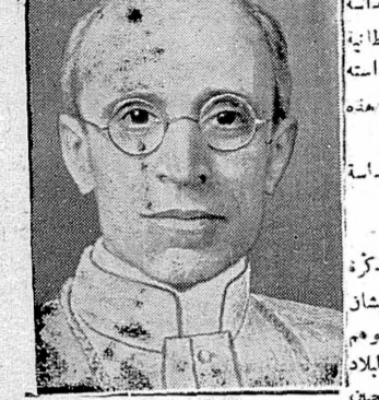
رئيس الحرب العربي الفلسطيني الى قداسته البابا يشكر قداسته لاهتمامه بقضية فلسطين وطلبه الى لجنة التحقيق المشتركة بان تحفظ هذه البلاد للقدسة لاصحابها العرب