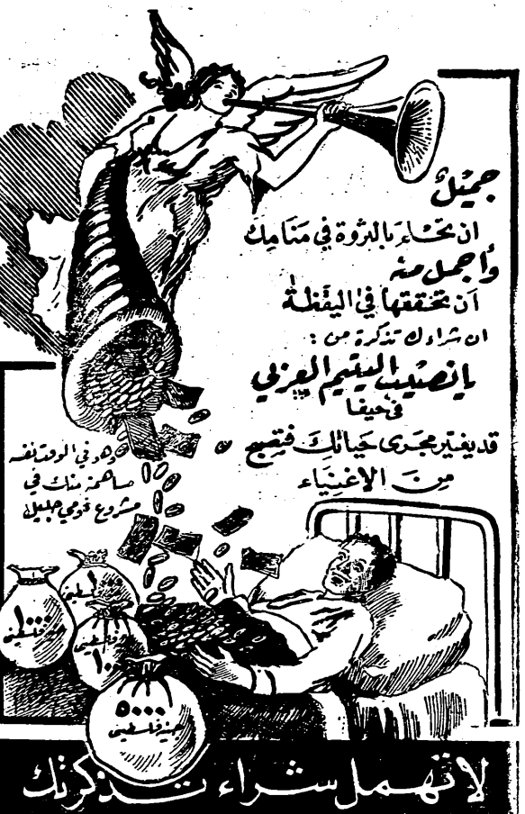
لوكله العموميون فلسطين «وكالة الجاعوني»

لأنه سيؤدي الى اغتصاب الحكم السوري... اننا نرى اليوم اننا نرى من ابناء اخرى امة، فيم يلي: