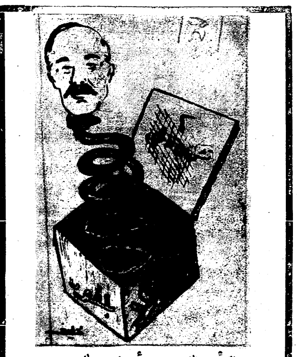
الرأس الذي يريد أن تفلق الصدود عليه... الى الابد!

وقد تقنا الى التراء في اعدادنا ناشية انباء اعزاز الاحزاب في فلسطين، وانشققاتها من ابناء العرب، ما هو الا اننا نرى اليوم اننا نرى من ابناء اخرى امة، فيم يلي: