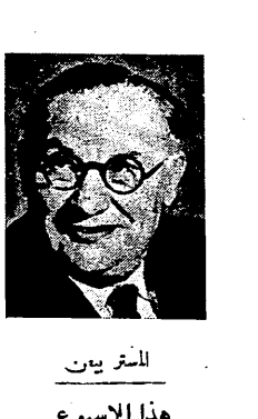
المستريين هذا الاسبوع لندن في ١٠ - ١٠ - وقد من المؤكد ان يلقى المستريين في مجلس العموم هذا الاسبوع نياتا مطولا عن السياسة التي تتبتم بريطانيا اتخاذها خلال بضعة الايام القادمة. وستكون مشكلة فلسطين ومسألة التنبهة العربية ومسألة قرض الميار دولار الذي تروج بريطانيا الحصول عليه من أهم النقاط

الروابط الودية التقليدية مع بريطانيا والتعاون مع الرجال والحيرة الاجنبيين بقصد زيادة الرخاء في البلاد... وخطابه رفعته القاهرة في ١٠ - ٢ - لمراسل فلسطين الخاص - بالتلفون - خطبه مساء اليوم رفقة علي ماهر باشا في جمع حافل من الشيوخ والنواب واهل الاحزاب وقادة الفكر من الشباب المصري والسوداني في احدى الجبهات المصرية وتناول في خطابه علاقة مصر بالدول العربية وبريطانيا والدول المتحالفة ودعا الى تضامن القوى واتحاد الكفة ليمصر مجدها الذي تسمى اليه. ثم قال: ان مصر كانت مهد حضارتين وعليها ان تسترد مكانتها الدولية وتستعيد الروابط بالدول العربية وتنسى وسائل التعاون مع بريطانيا والامم المتحدة. ثم تحدث عن احوال مصر الداخلية فخطبها بسطا دقيقا وطالب بالنهضة والبرقية والاهتمام بشأنا كطالب باصلاح الموظفين والنسابة بشؤونهم ليتكسبوا من اداء واجيب اداء القوات البريطانية وادي النيل وتقوية كعظامها.