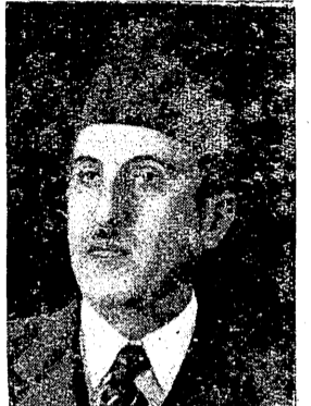
فخامة شكري القوتلي الجلسة السادسة

مجلس الجامعة يخصص جلسته لفلسطين ويقرر الاتصال باحزابها تداول الرسائل المتبادلة بينه فخامة شكري القوتلي وروزفلت بشأن فلسطين في اجتماع المجلس