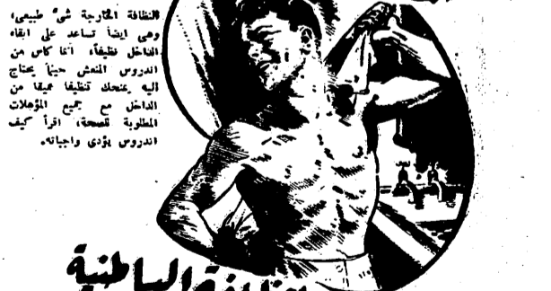
الخطافة الباطنية... في اوجها...