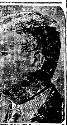
نورمبرغ في ٢٨ - سيبسط الانباء اليوم قصة ضم النمسا لالمانيا مؤيدة بالوامر العربية والتقرير وسجلات الواقع التي ضبطتها سلطات الحلفاء، وقد قال المستر الدرمان الوكيل الاميركي للنائب العام (في النمسا) تشاهد البنية الاولى ما اصطلاحاً على تسيته باليابور (فألمانيا)

سباحة المفتي الاكبر لندن في ٢٨ - التي في مجلس العموم البريطاني اليوم سؤال من ساحة المفتي الاكبر، فقد طلب النائب الهلالي بورتور ان يعرف ماذا كان الرد على طلب الجامعة العربية لعودة سباحة الى فلسطين، وعمما اذا كان وزير المستعمرات ينوي ان يملك الجامعة العربية ان تصير هنزل هو عضو الامبراطورية البريطانية ويسمى على هذا الاساس؟ فاجاب المستر جورج هول وزير المستعمرات قائلا: «اني لم اتفق اي طلب من هذا النوع، وعلى ذلك فالقسم الثاني من السؤال لا لزوم له» بورتور: «الاستفتاء ان الوقت قد حان لان تحدد الحكومة البريطانية موقفها من الرجل؟» المستر هول: «يجب قبل هذا ان يكون الرجل بين ايدينا»