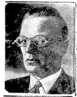
سائس انكوارت بإحضار الشاهد اذا تبين لها ان ذلك ضروري وعندما قرأ البرلمان اسم الاميرال دونت خليفة هنزل في المحكمة لمدة ايام لقلال امتنح هذا الاول مرة وهو رأسه وربت على كتف فيرغ وقد التفت اليه غير نغ ثم قلده في من رأسه البقية في صفحة ٤