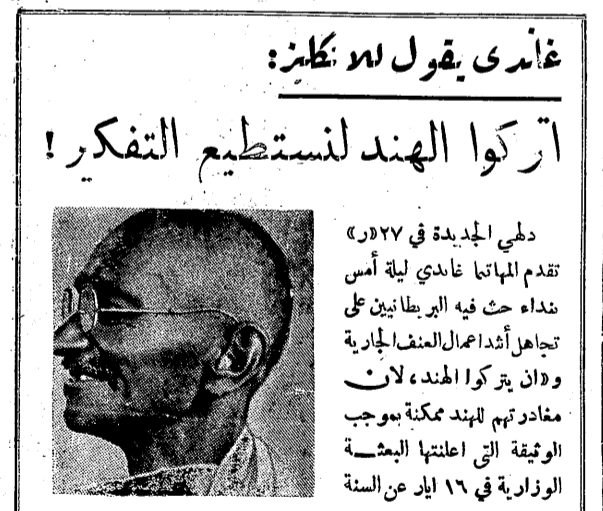
غاندي يقول له: نظنك: اتركوا الهند لتستطيع التفكير!