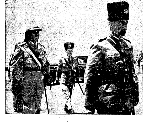
حضرة صاحب الجلالة الملك عبد الله ملك المملكة الاردنية الهاشمية وقد اخذت جلالت هذه الصورة يوم عيد استقلال القطر الشريف وظهر خلف جلالت صاحب السمو الملكي الامير حلالو ولي العهد والى يمينه الفريق كلوب باشا قائد الجيش العربي

تبادل برقيات التهنته بين الئيس السوري و جلالة الملك عبد الله عمان في ٢٧ - ١٠ - تلقى جلالة الملك (الاردني الكرم) و قد اجاب جلالة بالبرقيات التهنته وسرور تهنيت البرقية السامية بالتهنئة بمناسبة عيد استقلال المملكة الاردنية ومرور حول جلالتكم باطيب التهانئ مقرونة بخالص تمنيات السعادة لشخصكم الكريم والرغاء للشعب