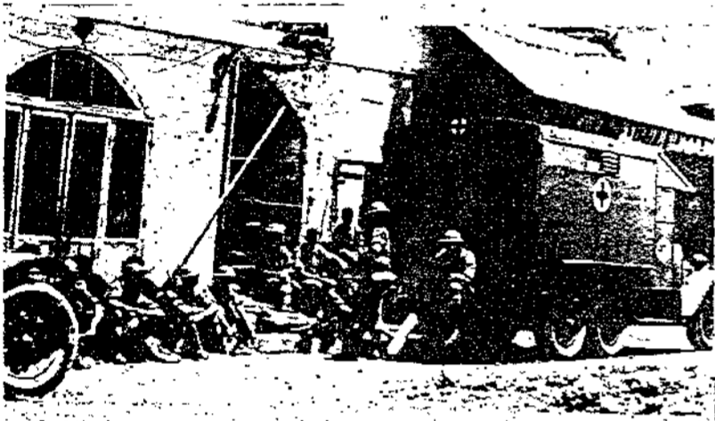
أفريق من الجيش البريطاني وهو يرا بطريق شوارع القدس ومعه سيارة اسعاف مسلحة