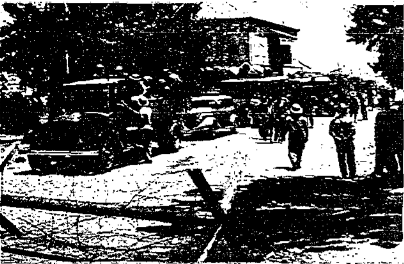
سيارات الاهالي في القدس استولى عليها الجيش وشحنها بالسلك كقصد ايجاد الجنود عند اشتباهم مع المجهدين في معركة حامية على طريق نابلس. وقد ظهرت الشوارع وهي مسدودة بالاسلاك الشائكة