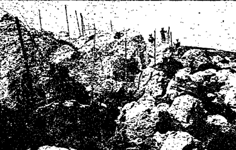
الاسلاك الشائكة التي يقبضها الانكليزيين فلسطين وسورية وقد ظهر العمال وهم يصنعونها