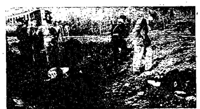
جثث شهداء من العرب في فلسطين عليهم اليهود بقنبلة بمجرور حيفا ولكن الأتكلن لم يقبضوا على أحد منهم ولا طعموا ما توهمهم على اليهود لظلمهم من أجل الفاجعة