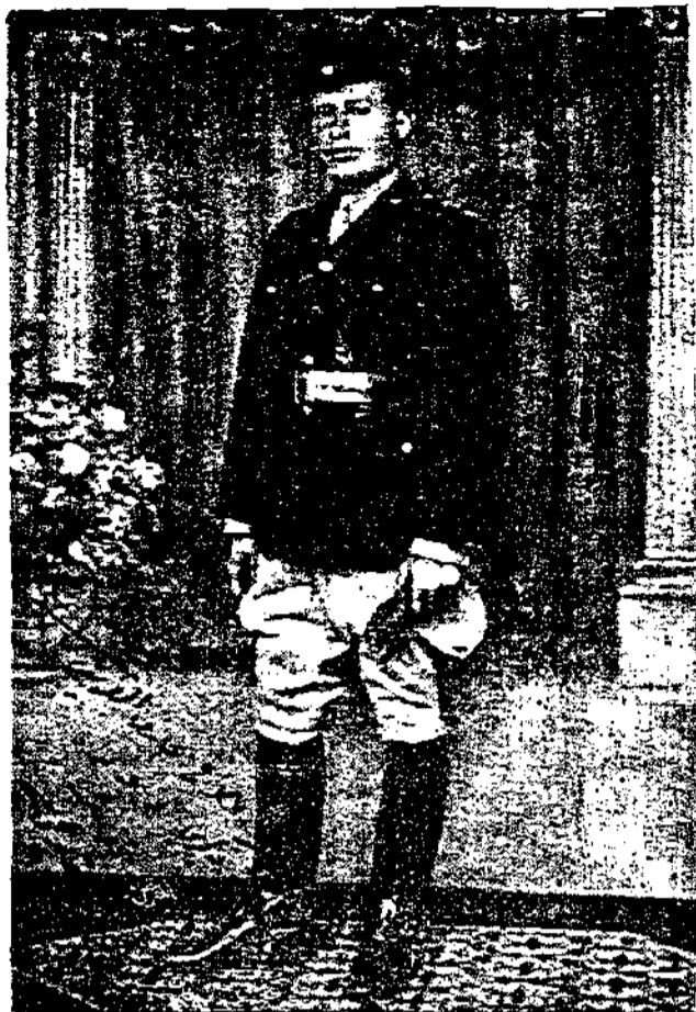
آخر صورة للمجاهد الكبير فوزى بك القاوقجي

وموقف الانكليز وحكومتهم منها والتطورات الاخيرة