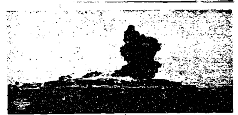
منظر قرية شعب شمال فلسطين عند ما نسفها الإنكليز بالديناميت وقد ظهرت الأتجار فيها بشكها الطمع الرهيب وظهر السخان وغبار أفضاض القرية يتصاعدان إلى السماء ، وقد أصبحت تلك القرية الزاهرة أكوامور كاهن الحياطة تبت أيدي الظالمين