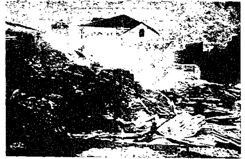
سازل كثيرة أحرقت ودمرت في الحلى العربي المسيحي في القدس الشريف أعان الله أصحابها وعوضهم وعاقب ظالمهم