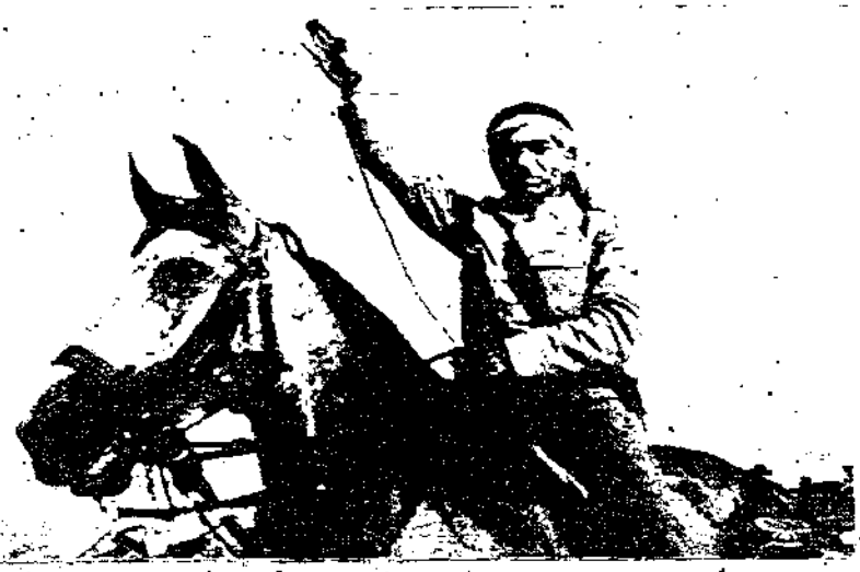
المجاهد المظير البطل عارف عبد الرزاق في ثورة فلسطين

ثم رجم الجنود (البواسل) الى البيوت النازعة فزعوا ابوابها ونافذها وكل الادوات الخشبية التي فيها. كالفاعد والحزائن والطاولات ووضعوها في داخل المنازل وراشعلوا فيها النار التي ائت عليها وعلى البيوت ايضا وهكذا فان بيوت القرية قد تحوت كلها الى اطلال دارة من جراء التيران التي اشعلت فيها