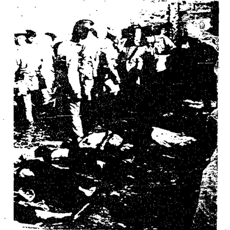
يذكر القراء ان الجيش في فلسطين قد وضع ألغاما في سوق الخضر في حيفا بالصيف الماضي ففجرت عند اكتظاظ السوق بالباع والملاحين والمشرتين وقد أسفرت تلك الفواجع عن قتل وجرح ١٥٠ عربيا ، ويرى القراء في هذا الرسم الملون ناحية من أساحة الخضر وقد صفت فيها جثث بعض الشهداء ورحمهم الله