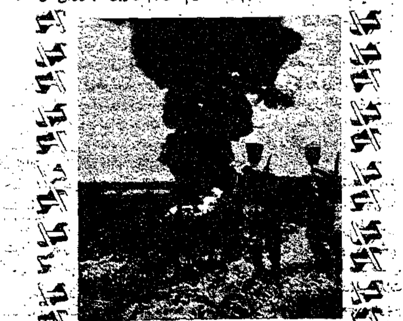
أعمال الخمدون النار في أبناب التورن بنلسطين وقد ظهر اليهود يتصاعد ووقف جنديان يهوديان يفرجان