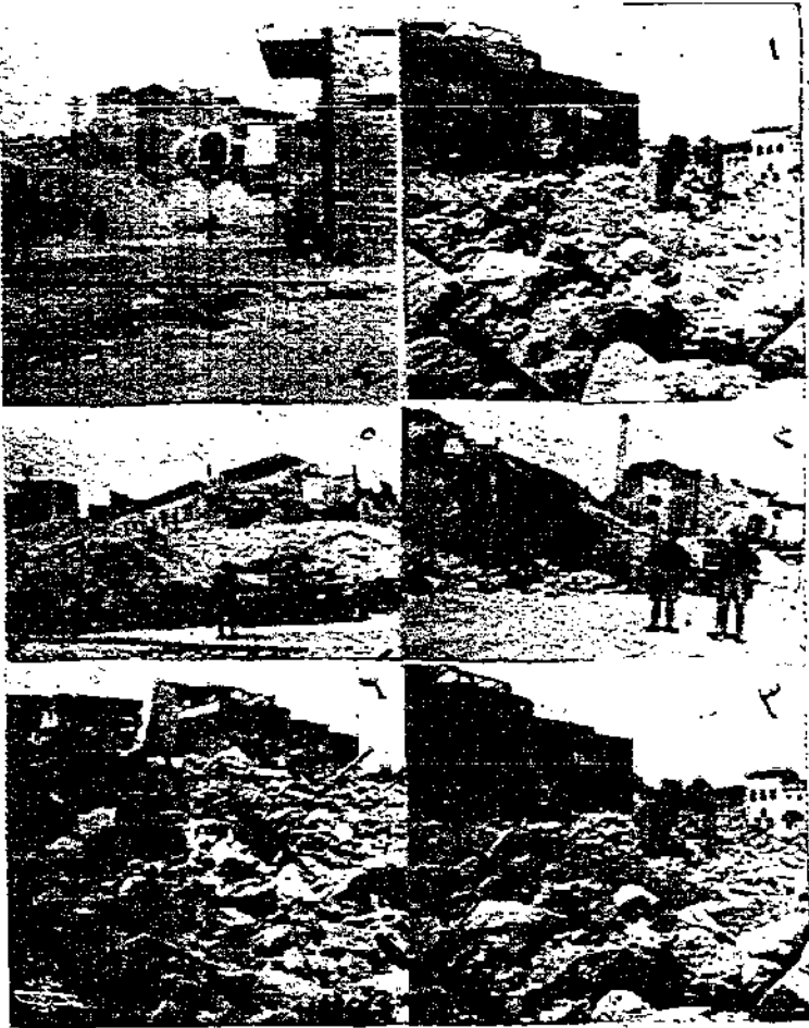
تتم الرسوم الستة بعض مناظر تحرب الجيش البريطاني لمدينة يافا نسفها بالبنات