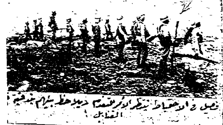
تتم الرسوم الستة بعض مناظر تحرب الجيش البريطاني لمدينة يافا نسفها بالبنات

فوق هذا ثلاث صور للسورة رقم ١٠٠ بين جانبا من مجهر الاحمال في احدى المناسبات الوطنية والصورة التي الى جانبها تظهر فرقة من المجاهدين وهي بأسلحتها وقد عرضت مدافع رشاشين أشرفا باليد بسهمين وهما من السلاح الذي غنمه المجاهدون من الانكليز وماربوم به . وتبين الصورة العمل الكبير جماعة من المجاهدين وهم على وشك الهجوم وقد أشرفا باسم إلى بتدقية غربية وهي تتدق قنابل اليد إلى مسافات بعيدة وهي أيضا مما غنمه المجاهدون من الاعلاء