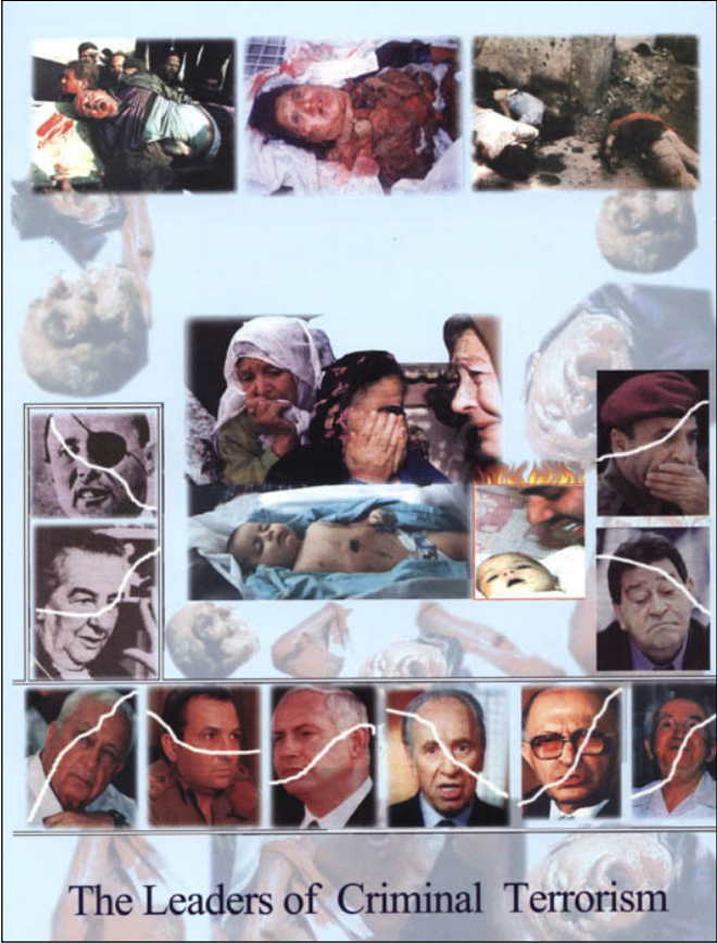
Some victims of their massacres