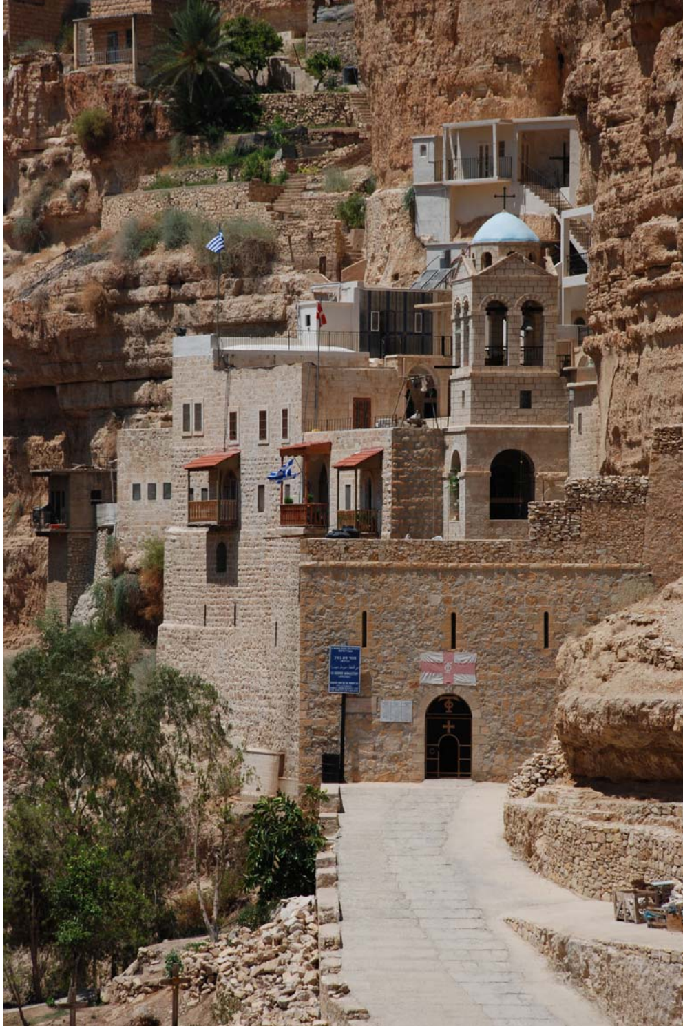
صورة 1: دير القلط