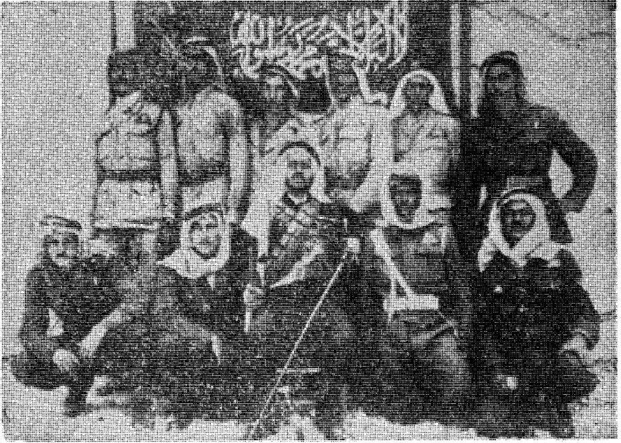
صورة لبعض المجاهدين السعوديين وفوقهم العلم السعودي