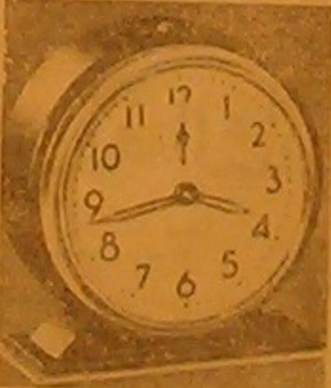
ساعة منيعة جميلة