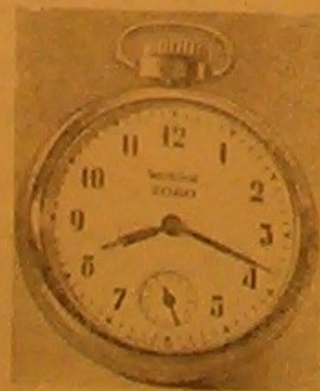
ساعة جيب مكملولة