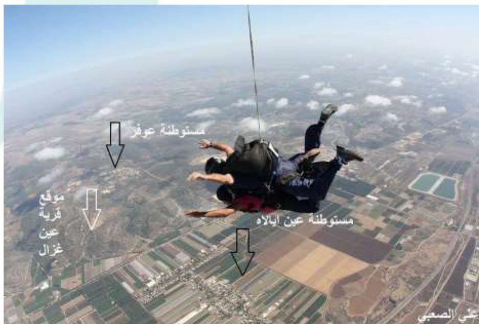
صورة التقطت من الجو ويظهر في الصورة موقع قرية عين غزال الاصلي والمستوطنات المقامة على اراضي القرية والمتمثلة بمستوطنة عين ابلااه غرب اراضي القرية ومستوطنة عوفرا شرقها