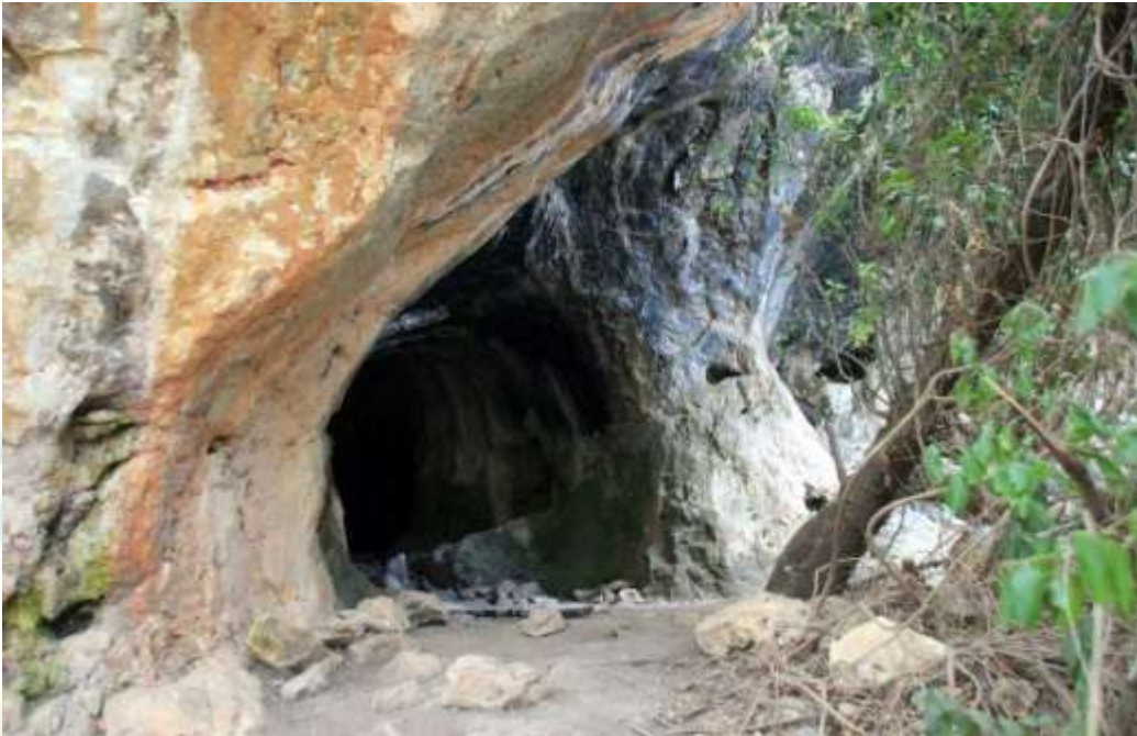
مدخل مغارة النمرية