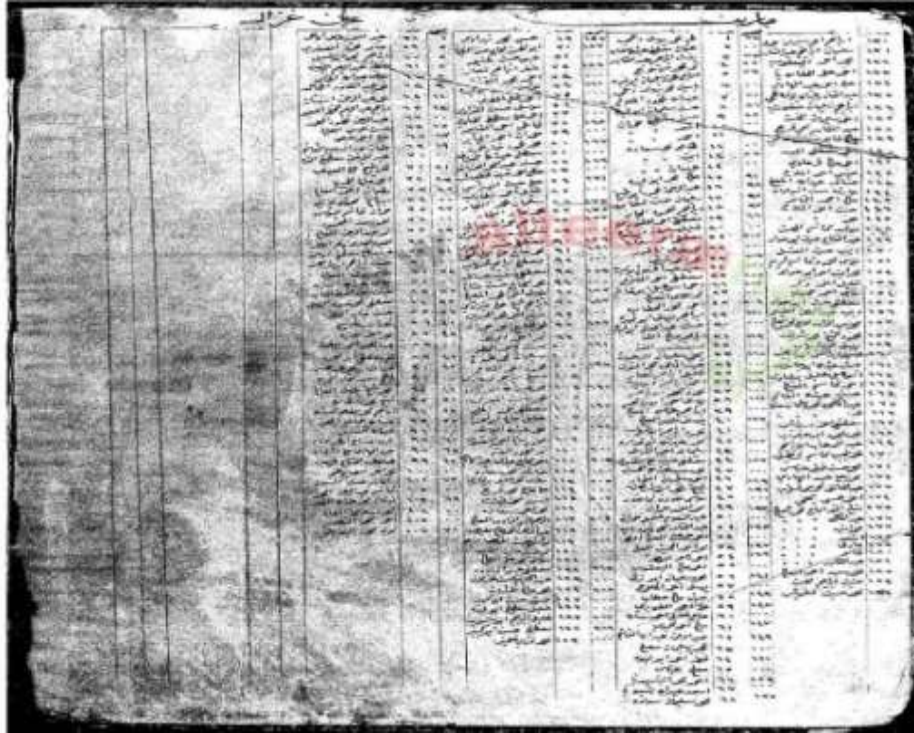
الشكل رقم (4) صورة عن إحصاء القرية في العهد العثماني عام 1911