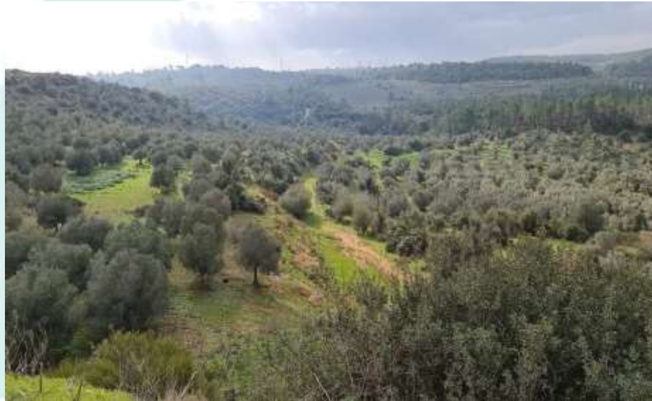
شجر الزيتون في القرية