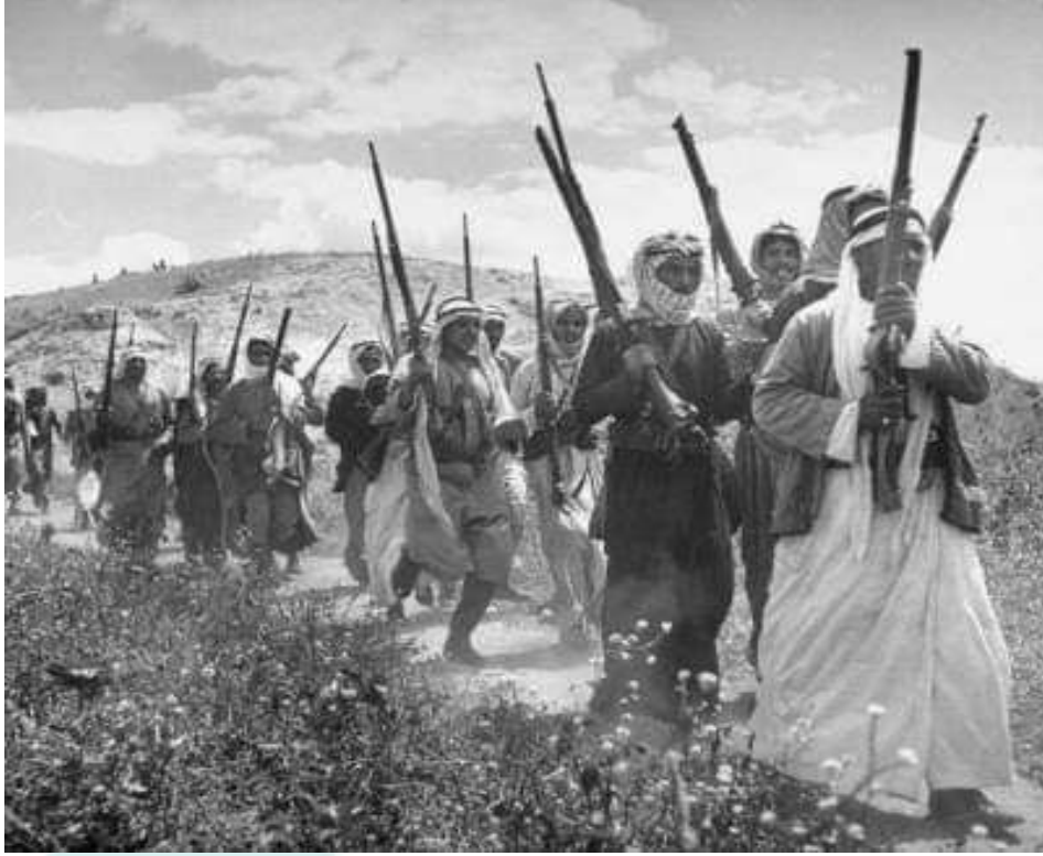
صورة للمقاتلين من القرية في حرب ال 1948