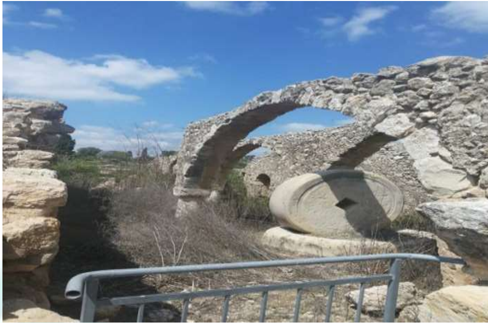
الشكل رقم (6) معصرة الزيتون

كان يوجد في القرية معصرتان بدائيتان رومانيتان للزيتون، إحداهما في وسط القرية، والثانية غربها. وهما عبارة عن حجر مبروم من صخر الغرانيت له يدان حديدتان تحرك بواسطة العاصر بمنة ويسرة، ويتم عصر الزيتون وتم يصفى الزيت الحاصل آلياً أي يفرز الماء عن الزيت. 34