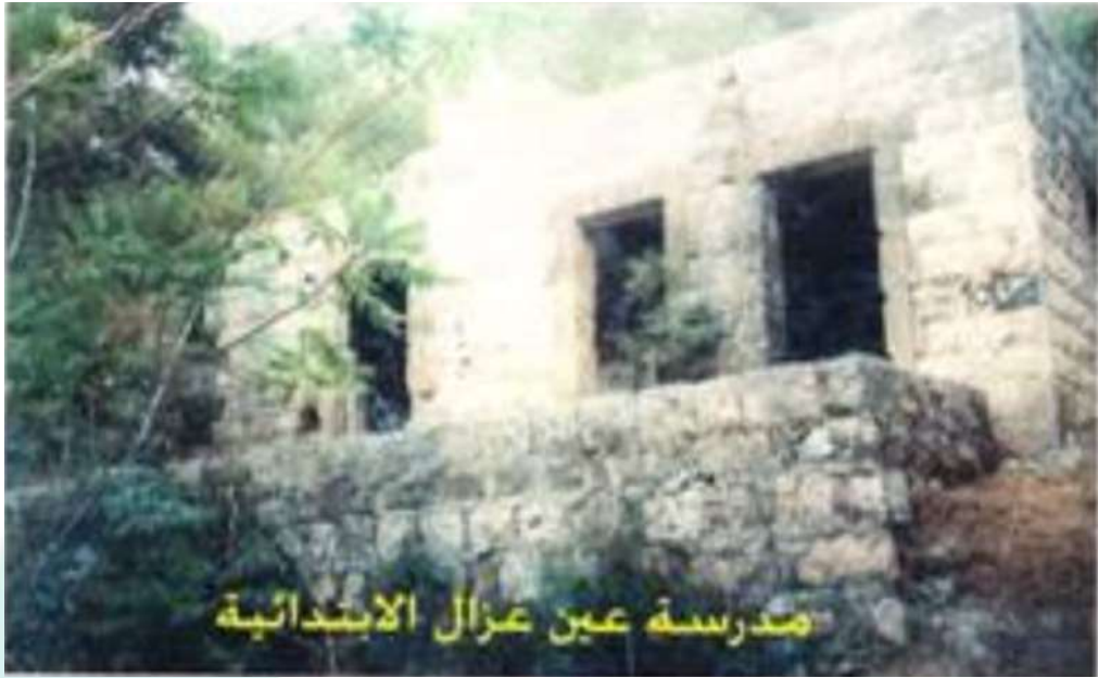
الشكل رقم (11) مدرسة قرية عين غزال