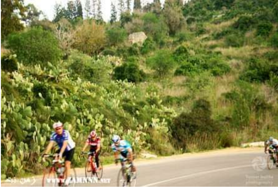
صورة حديثة للقرية