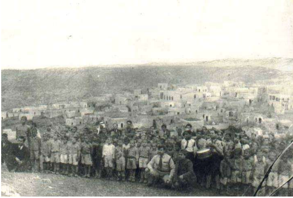
الكشافة عام 1947 وتظهر خلفهم القرية التي دمرتها العصابات الصهيونية