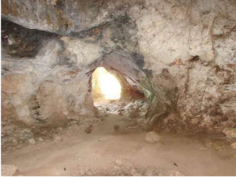
مغارة النمرية من الداخل