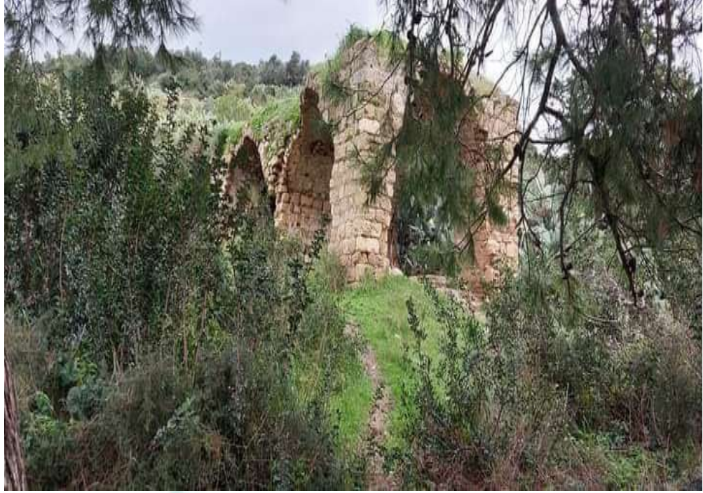
صورة لأحد الآبار بالقرية عين غزال قضاء #حيفا