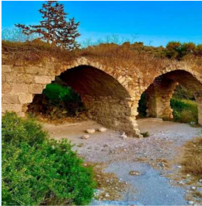
الشكل رقم (3) خربة السوامر