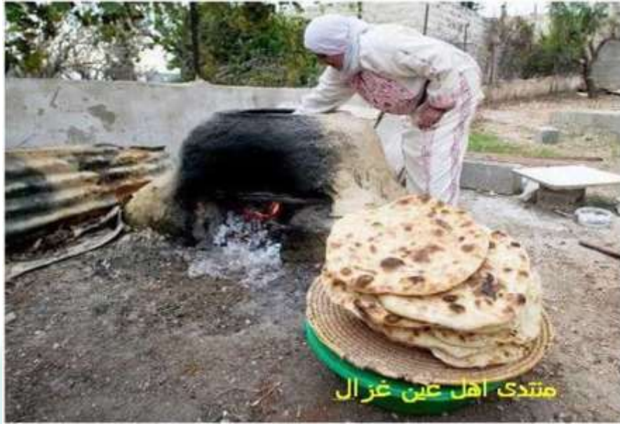
الشكل رقم (7) فرن الطابون

لم يكن في القرية أي مطحنة لذلك كان الأهالي يطحنون قمحهم في قرية جبع المجاورة، ولم يكن فيها أي محبز قبل النكبة، وكان لكل بيت في القرية فرن عربي (الطابون) 35 لصناعة ما يحتاجه الفلاح من خبزه اليومي.