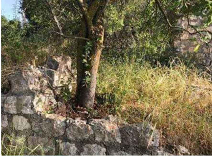
بقايا جدران أحد البيوت المدمرة