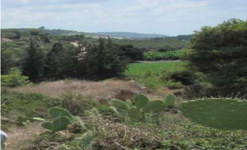
الصار في منطقة جبل الراس