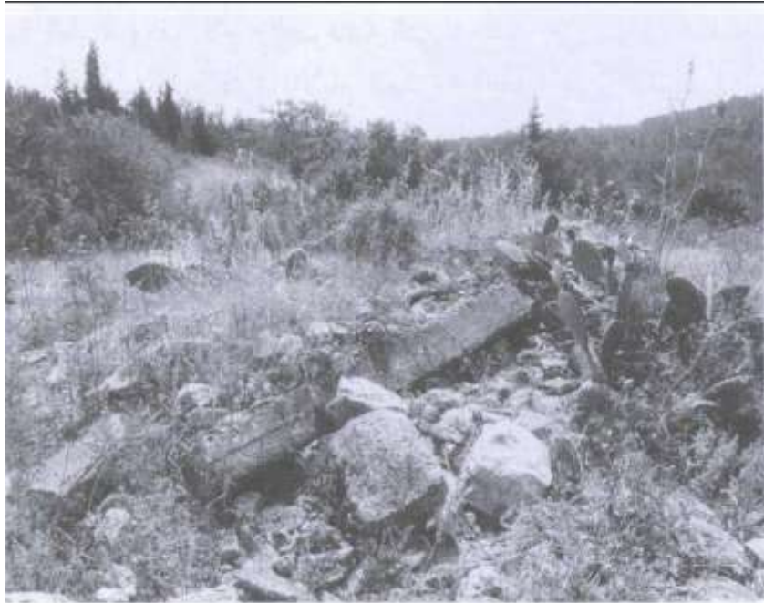
أنقاض في موقع القرية (أيار/ مايو ١٩٨٧) [عين غزال]

قبر الشهيد محمد قاسم / مقبرة عين غزال قضاء #حيفا