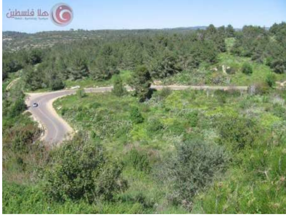
الطريق إلى القرية