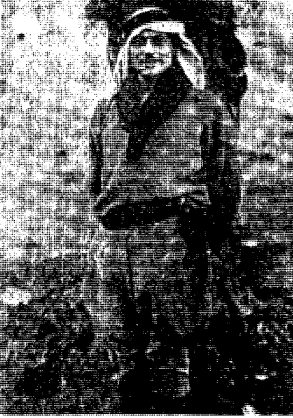
المجاهد القائد فوزي القاوقجي في فلسطين سنة 1936 .

الإنكليز أن يتغلبوا عليها خرج من العراق فلاحقته الطائرات الإنكليزية وقصفت سيارته فأصيب إصابات كثيرة، ونقل بالطائرة إلى ألمانيا حيث عولج وشفي، وبقي في ألمانيا ينشط مع رجال الحركة الوطنية العربية من عراقيين وفلسطينيين إلى أن انتهت الحرب وعاد إلى سورية والعراق. وحينما أنشئ جيش الإنقاذ من أجل الكفاح ضد التقسيم في سبتي 1947 و1948 اختير ليكون قائداً عاماً له، وذهب على رأسه إلى فلسطين حيث بذل جهده في الحرب العربية اليهودية قبل دخول الجيوش العربية في 15 ميس 1948، وحينما انعقدت الهدنة بين العرب واليهود عاد إلى لبنان بيروت، وأقام فيها إلى أن وافته منيته في سنة 1976 رحمة الله عليه.