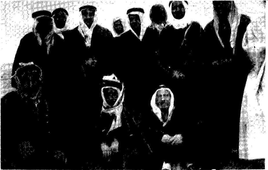
وفد اللجنة العربية العليا في الطريق الى زيارة الملك عبد العزيز آل سعود سنة 1936 . ويظهر من الشمال الى اليمين : الشيخ كامل القصاب عضو الوفد - معين الماضي عضو الوفد - عزة دروزة عضو الوفد - الشيخ يوسف ياسين مندوب الملك عبد العزيز آل سعود .