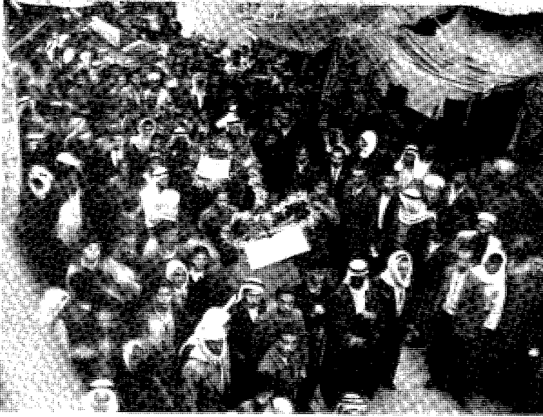
موكب جنازة الشهيد محمد بشير الشيخ ياسين في نابلس في حزيران 1936

بالدفاع عن بلاده والثقة بأنفسهم، وتأييد شعب فلسطين في كفاحه.