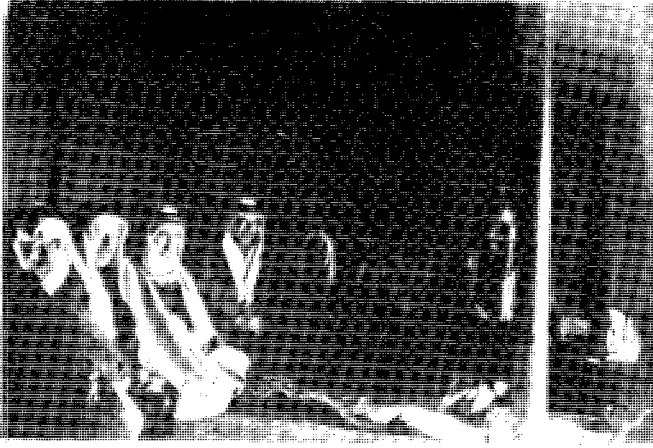
وفد اللجنة العربية العليا الفلسطينية في مقابلة الملك عبد العزيز آل سعود سنة 1936 . على يمين الملك . معين الماضي - الشيخ كامل القصاب - عوني عبد الهادي - عزة دروزة .

من موضوع إلى موضوع بلهجة بدوية ونبرة قوية، ولا يكاد يسمح لسامع بالكلام إلا جواباً على سؤال منه أو تأييد لما يقوله أو يطلب منه . ويشعر المرء بقوة إرادته وقوة شخصيته وذكائه ودهائه وثاقب عقله ونضجه وصراحته معاً، مع القول إن معارفه الموضوعية غير واسعة، وأن ما يقوله في صدد أحوال البلاد وشؤون الساعة والسياسة نتيجة مسموعات وتخمينات وتوقعات مستندة إلى بعض الوقائع . وهو حريص على استماع أخبار العالم العربي والخارجي، وله موظفون يتسمعون بصورة منتظمة للإذاعات ويقدمون خلاصات ما يسمعونه بمذكرات صغيرة، فيقرأها أو بالأحرى تقرأ له في مجالسه ليكون بذلك ملماً بما يجري .