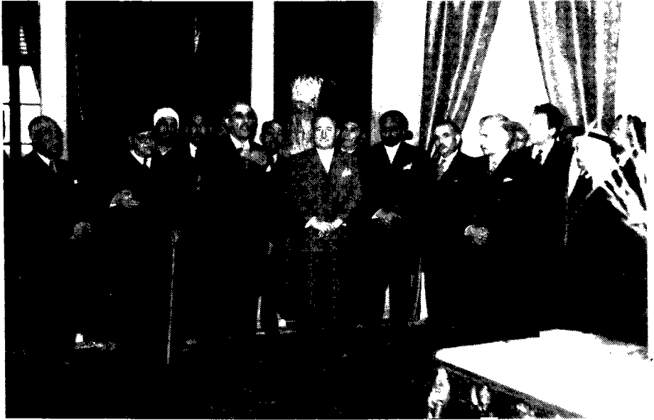
فلسطينيون مقيمون بدمشق في زيارة لرئيس الجمهورية السورية شكري القوتلي لتهنته بالوحدة السورية المصرية في 22 شباط 1958 . الرئيس شكري القوتلي وعن يمينه محمد عزة دروزة وزكي النجمي وعن يساره طاهر النجمي، حمدي النابلسي، شوقي عبوش وعبد الرحمن الحاج ابراهيم .