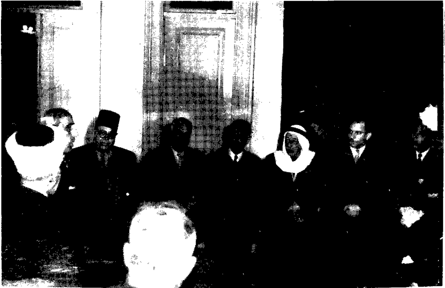
فلسطينيون مقيمون بدمشق يهتتون الرئيس شكري القوتلي باعلان الوحدة السورية المصرية وقيام الجمهورية العربية المتحدة شباط 1958 . الرئيس القوتلي في أقصى اليمين وعن يمينه محمد عزة دروزة وزكي النجمي وآخرون .