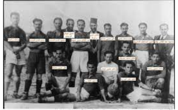
فريق كرة القدم في السافرية 1940 م