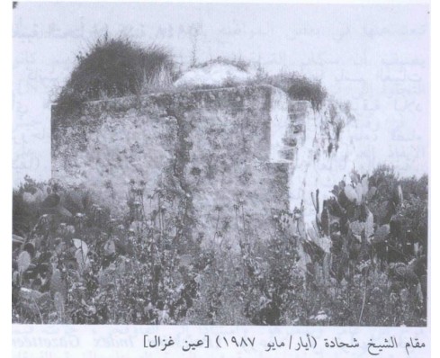
مقام الشّيخ شحادة (أيار/ مايو ١٩٨٧) [عين غزال]

• مقام الشّيخ شحادة [5] هو المبنى الوحيد حالياً الذي بقي شامخاً حتى الآن رغم محاولة المتطرفين تغيير هذه الهوية الدينيّة لهذا المقام. ويقع جنوب القرية بين المقبرة والمدرسة وأقرب دار لهذا المقام دار سعد العصفور، وقد كان للشّيخ أسطورة مروية تقول أنّ الشّيخ شحادة كان يتوضأ على عين القرية وهو يحمل إبريق من الفخار، وعندما نظر إلى البحر وهو على مد البصر، فشاهد مركب في البحر يحمل يهودا وأنهم قادمون لإحتلال فلسطين، فرمى الإبريق على المركب وهو في البحر فأصابه وأغرقه بمن فيه، على قول الأساطير.